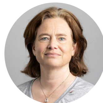
Bettina Weissenbrunner Kommunikation